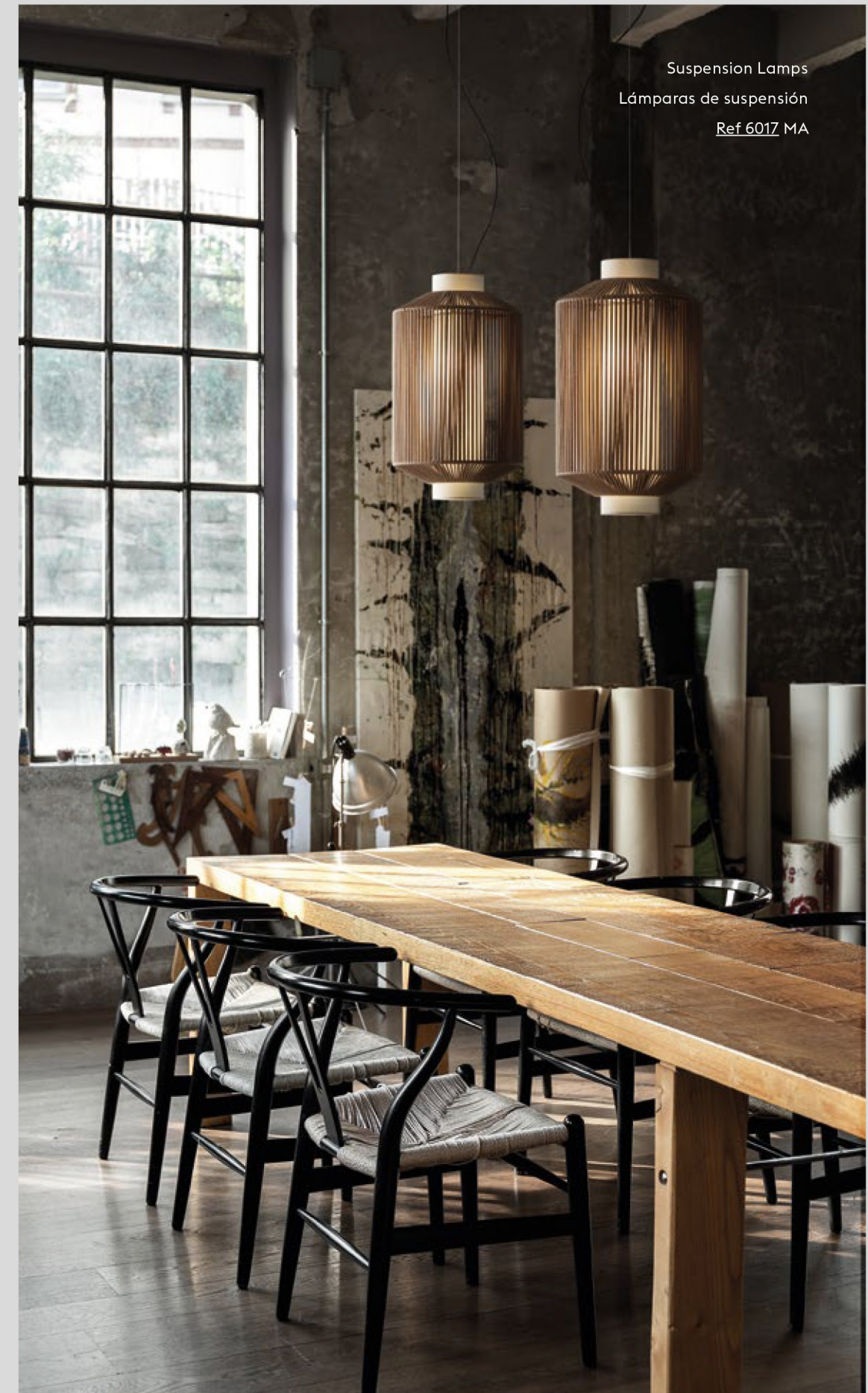
Suspension Lamps Lámparas de suspensión Ref 6017 MA