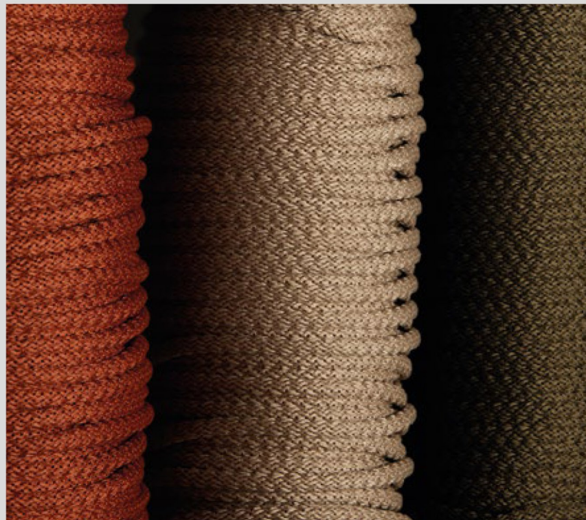
Rope color details Detalle colores cuerda